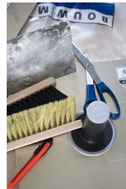
Fotobijbschriften? 1. Xxxxx xxxx xxxxx xxxxx 2. Xxxxxx xxxxx xxxxx xxxxx xxx